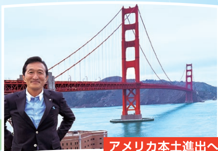
アメリカ本土進出へ