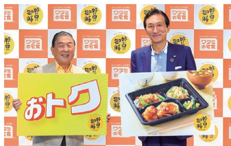
「好い日の御膳」累計300万食突破！ おかずのみ450円、ごはん付きは500円

ころシリーズ」についても、出汁と健康訴求による差別化を図りながらメニューの充実を進めてまいります。