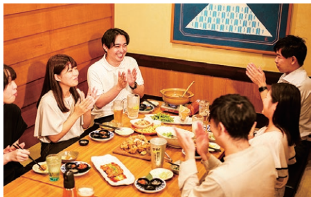
居酒屋業態の好調を支える宴会需要 約100店舗で月間最高売上更新

2025年度は、総じて堅調な1年であったと評価しています。国内外食事業が全体の業績を大きく牽引しました。特に居酒屋業態においては、年末商戦で約100店舗が月間最高売上を更新するなど、宴会需要が好調に推移しております。コロナ禍を経て宴会に対応可能な店舗が減少する中、団