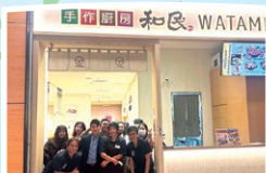
台北「和民 手作厨房」