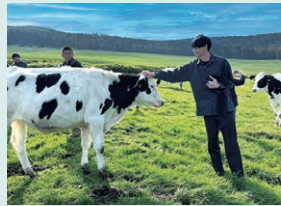
「紡ぐツアー」で美幌峠牧場を訪問

ワタミの外食店舗などで美幌峠牧場のグラスフェッドミルクを使用した「美幌グラスフェッドアイス」を販売しております。また「紡ぐツアー」として、社員がワタミファームの牧場や農場などを訪問し、食材という命やつくり手の想いを直接感じる体験を実施しています。これにより、ワタミモデルとSDGsのつながりを学び、商品に込められた思いやこだわりを、お客様や従業員へ届けるための取り組みをしています。