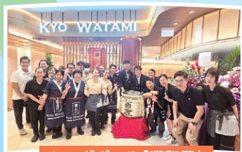
シンガポール「饗和民」