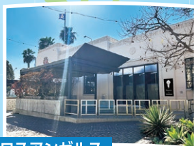
ロスアンゼルス 「Hayama by WATAMI」