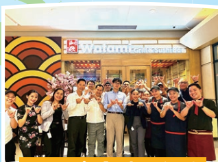
フィリピン「居食屋 和民」