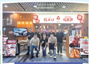
上海「三代目 鳥メロ」