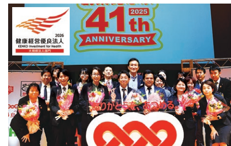
「健康経営優良法人」に5年連続認定 賞賛の機会を大切にして社員の幸福度も向上