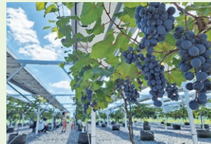
ソーラーシェアリングのもとでぶどうを栽培