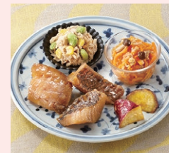
「勝浦のブダイの煮つけ」

ワタミの宅食ダイレクトでは、千葉県勝浦市産の低未利用魚「ブダイ」を活用した「勝浦のブダイの煮つけ」を発売しました。本商品は、地元の漁業組合や企業と連携し、開発・商品化を実現したものです。近年、海水温の上昇などにより「磯焼け」が進行し、藻場の減少が海洋生態系へ影響をおよぼす中、こうした課題の一因とされる低未利用魚を有効活用することで、水産資源の持続可能な循環と地域漁業の支援の両立に取り組んでいます。今後は、本取り組みを千葉県でのモデルケースとして全国へ展開してまいります。