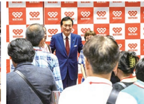
株主様と触れ合いのため 会長との記念撮影を実施