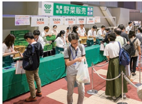
ワタミファーム産有機野菜などを販売 多くの株主様で盛況となりました