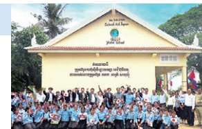
プレククタアン小学校贈呈式

SAJがこれまでにカンボジア・バングラデシュ・ネパールの3か国で建設した学校は累計389校になりました。カンボジアでは現在、貧富の差を背景とした都市部と農村部の教育格差が深刻な話題となっています。農村部では慢性的な貧困により、激しく老朽化した危険な校舎での授業や、複数学年が同じ教室で学ぶ授業を余儀なくされている地域が少なくありません。さらに、カンボジア政府は今年度より、午前・午後の2部制から朝から夕方まで授業を行う1部制への移行方針を示したことで、同時帯に全学年の生徒を受け入れる必要が生じました。これにより、既に教室数が不足している状況に加え、今後さらに不足が拡大する見込みであり、より深刻な事態に直面しています。こうした教育環境の急激な変化と切迫した課題を踏まえ、SAJは教室不足や老朽化に苦しむ地域の実態調査を強化し、子どもたちの命と学びを守る学校建設事業を継続してまいります。