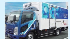
水素トラック（災害時には電源として活用）