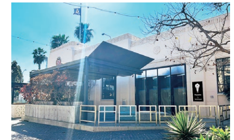
米国ロスアンゼルスにオープン 居酒屋「Hayama by WATAMI」

〈海外〉今春には、米国ロスアンゼルスに居酒屋「Hayama by WATAMI」をオープンいたします。白を基調とした安らぎのある空間で、寿司や小料理をはじめとする多彩なメニューを提供します。Hayamaはロス