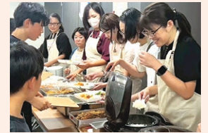
ワタミ本社で開催している「SA」子ども夢食堂でも提供

ワタミは、農林水産省の「食品ロス削減緊急対策事業」に参画し、「もったいないおかず」プロジェクトを推進しています。本事業は、自社工場で発生する未利用惣菜（お弁当に盛り切れなかった冷蔵惣菜など）を冷凍加工し、既存の物流網を活用して、食料支援を必要とする子ども食堂や福祉施設へ寄贈することで、社会福祉と食品ロス削減を両立する取り組みです。今後は、運用体制の確立と全工場への展開を目指してまいります。