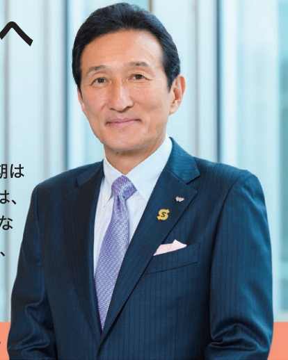
ワタミ株式会社 代表取締役会長 兼 社長 CEO 渡邊 美樹 Miki Watanabe