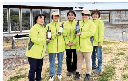
ワタミオーガニックランド産ぶどうを使用 復興の象徴として、地域とともに育むワインづくり

3月には、北海道美幌峠牧場が環境省より「自然共生サイト」として認定されました。これは、2030年までに陸と海の30%以上を保全する国際目標「30by30」の達成に向けた制度であり、牧場としては国内初の認定となります。今回の認定取得をモデルケースとし、全国に展開するワタミファームの各拠点においても、生物多様性に配慮した循環型農業および酪農のさらなる推進を図ってまいります。