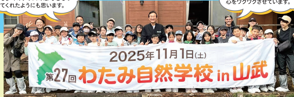
2025年度は11月に延期し千葉県山武市で開催しました

よく考え、たくさん楽しむこと ができたようで、大きく成長 して帰ってきました。今でも 心をワクワクさせています。