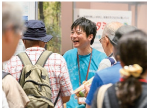
「株主総会会場で催し物を開催」 事業活動を直接ご紹介する大切な機会