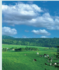
ワタミ美幌峠牧場

2026年3月、ワタミ美幌峠牧場（北海道）は環境省の「自然共生サイト」に認定されました。「自然共生サイト」とは、民間の取り組みによって生物多様性が保全されている場所を認定する制度です。本牧場では、農業や化学肥料を使用せず、約300haの広大な有機牧草地において放牧型酪農を実施し、土壌や地下水、河川への環境負荷の低減に取り組んでいます。こうした持続可能な生産活動が評価され、牧場として国内初の認定取得となりました。森から水辺、そして草原へと連なる命のつながりを守りながら、今後にも牛にも生き物にも優しい有機酪農を推進してまいります。