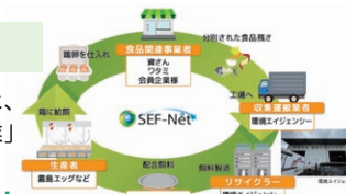
福岡市食品リサイクルループ

SEFは、賛助会員であるワタミ株式会社および株式会社資さんと共同で構築し、2024年度に福岡市、山口市・宇部市を対象に申請していた「再生利用事業計画(食品リサイクルループ)」において、新たに2件の認定取得を支援しました。本計画は、両社の事業活動から発生する食品残さを資源として循環させる取り組みです。回収された残さは飼料へと再生され、その飼料で生産された「鶏卵」を各社が自社店舗等で食材として再び活用するという、実効性の高いリサイクルループを実現しています。食品残さを貴重な資源と捉え循環させることで、「食べ物を捨てない社会」の構築を目指すとともに、地域と連携した持続可能な循環型モデルの先駆けとして、今後も環境負荷の低減と資源の最大化に邁進してまいります。