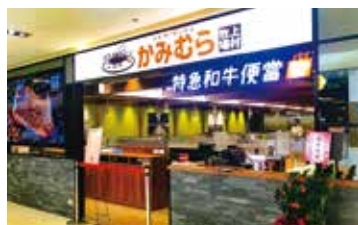
台湾でも人気の「かみむら牧場」

開店後1時間にして、その日の予約がいっぱいになってしまうお店。2020年11月、台湾・台北市にオープンした幸せの焼肉食べ放題「かみむら牧場」微風広場店は、いまでも週末には開店後1時間ほどで、その日の予約が埋まってしまう。「かみむら牧場」としては初の海外出店で、日本で育ったブランド和牛「薩摩牛」を食べ放題で楽しむことが人気の要因です。