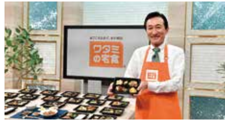
BS放送でテレビショッピング開始

コロナ禍で外食事業が大きな打撃を受ける中、ワタミグループの事業の柱になっているのが宅食事業です。今年度、さらに注力し、24万食から30万食まで6万食増