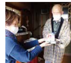
まごころスタッフのおすすめがポイント

2月1日から「ワタミの宅食」と明治の乳製品等の宅配サービス「明治の宅配」が相互の商品を販売しています。新型コロナウイルスの影響により、外出を控えている方、健康を意識されている方のニーズにこたえる取り組みです。