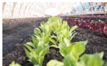
施設とともに農作物も生産

4月29日、岩手県陸前高田市に「ワタミオーガニックランド」がオープンしました。「ワタミオーガニックランド」は有機・循環型社会をテーマにしたオーガニックテーマパークで、段階的に設備を拡充していきます。将来は約23haという広大な施設をめざして整備を進めていく計画です。今回オープンしたのは岩手県産食材を活用したバーベキューが楽しめるバーベキュー棟、農作物を生産するハウス棟です。「ワタミオーガニックランド」の建設に向けて、3月には東京農業大学と連携協定を締結しており、土づくりから人材育成まで幅広い分野でさまざまな取り組みを進めています。