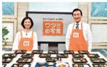
4月にはBSテレビ2局で放送しました

食事宅配サービスを行う「ワタミの宅食」は、4月5日よりBSテレビ放送でテレビショッピングを本格的に開始いたしました。コロナ禍において、食事のデリバリーに対するニーズは拡大する一方で、対面営業等は難しい状況が続いております。高齢者を中心とした「外出自粛層」に商品の魅力やサービスの利便性を訴求するため、テレビショッピングに参入しました。