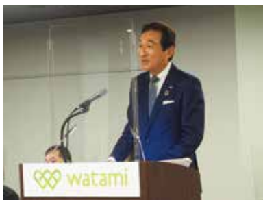
昨年の株主総会の様子

株主総会の様子については、後日ホームページにて動画を公開いたしますので、ご視聴ください。