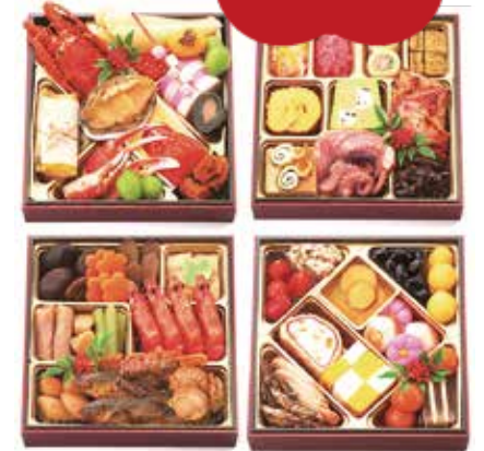
※写真は、昨年の「四段重」です。今回販売する商品ではございません。

毎年大人気! わたみのおせち 「わたみのおせち」は、 素材選びと味づくりに 手間ひまかけております。 毎年ご好評いただいている 人気商品です