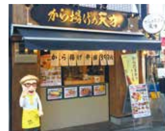
2021年度は200店舗を出店する計画