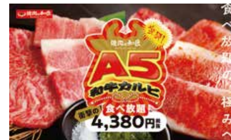
「焼肉の和民」ではA5和牛カルピで商品力強化

商売をしていて売れ行きが落ちると、つい変わったことをしたくなります。見た目の変わった商品や、お客さまが驚くような商品を打ち出して関心を高め、目先の売り上げを伸ばそうと考えがちです。しかし、それは違います。ベーシックな商品の価値を高