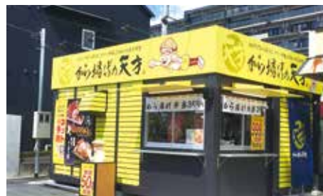
コロナ禍で店舗を増やした「から揚げの天才」

もともと「和民」は「居食屋」として、おいしいものを囲んで家族や仲間が集う、団らん