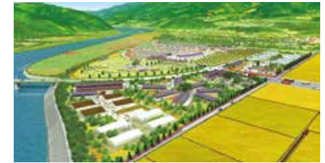
「ワタミオーガニックランド」完成予想図

陸前高田市は、確かに復旧しています。しかし復興はこれからです。復興に一番大事なのは、産業が興ること。地域のものをどうやって売るか、どうやって人を集めるか、具体的な提案をしていきたいと思えます。企業誘致を図って新たな雇用も生み、消費