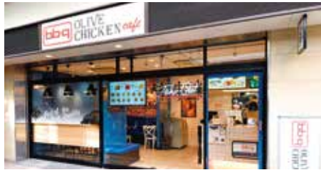
本格出店する「bb.q OLIVE CHICKEN café」

200店、「bb.q OLIVE CHICKEN café」80店、「焼肉の和民」20店、「かみむら牧場」10店です。