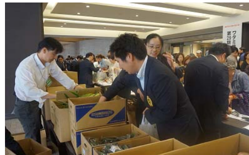
ワタミファーム野菜販売の様子