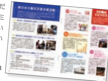
株主ふれあい通信

日頃よりご支援いただいている株主様に、ワタミへの理解をより深めていただけるよう作成しています。