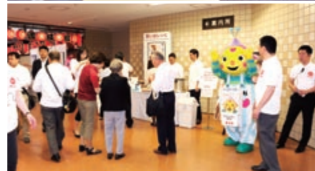
会場内に設置されたワタミの介護のブース