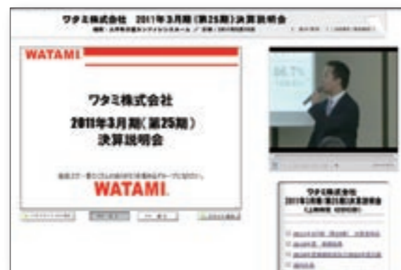
ワタミふれあいホームページでの決算説明会の動画配信