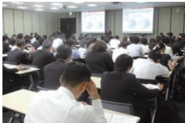
決算説明会の様子

さらに、機関投資家様、アナリストの方々に対してのスマールミーティングの開催や、IR担当者が直接訪問し、決算数値・事業内容についてお伝えする1on1(ワンオンワン)ミーティングを実施しています。