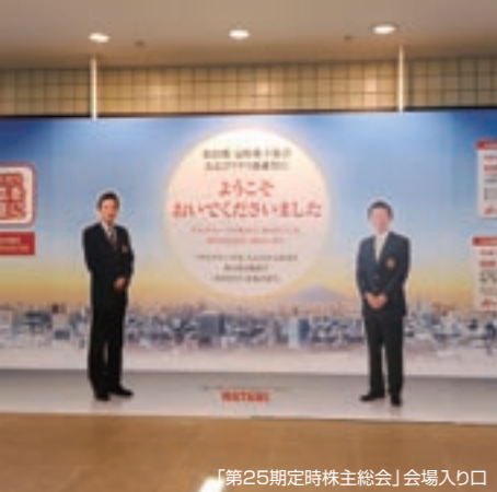
「第25期定時株主総会」会場入り口

ワタミでは、安定配当を維持、株主還元を図るとともに、迅速かつ正確な情報開示に努めています。また、積極的なIR活動を行うことに加えて、皆様のご意見に真摯に耳を傾け、活動に反映させることを基本としています。