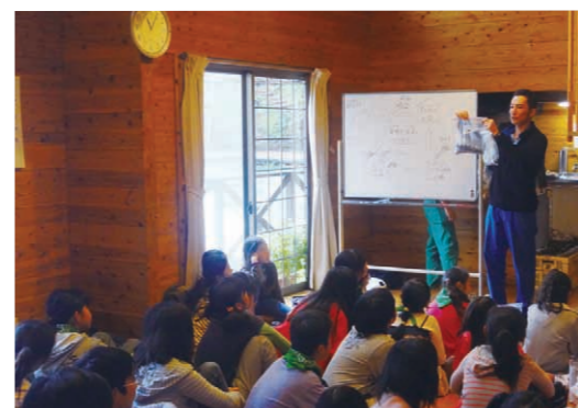
「資源と命の関わり」について説明をしている様子

子どもたちが環境や食について考えるきっかけづくりになることを目指し、今後も「自然体験ツアー」に協力させていただきます。