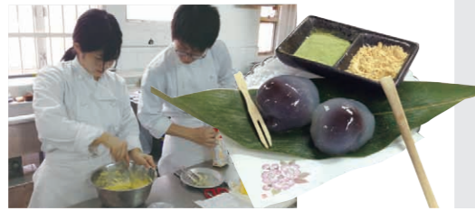
オリジナルデザートをつくっているインターン生の様子

※「産学官連携 課題解決型グローバルインターンシップ」とは、経済産業省が、次世代の日本の産業を担う学生を育てる教育プログラムとして企画したものです。