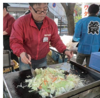
福祉施設での焼きそば販売の様子