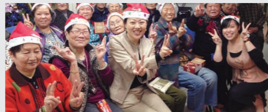
老人養護施設への訪問