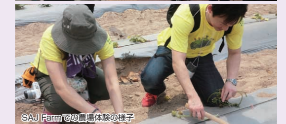
SAJ Farmでの農場体験の様子