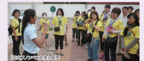
「王立ブノンベン大学」見学