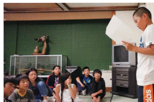
夢作文を発表している様子