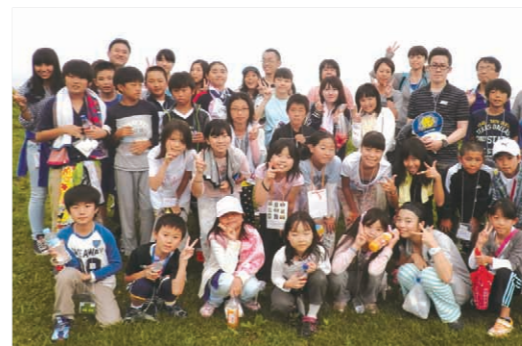
第16回わたみ北海道自然学校集合写真(ワタミファーム瀬棚農場にて)

第16回目となる2014年度は、北海道久遠郡せたな町役場の方々のご協力のもと、せたな町にて、8月5日～8日の3泊4日で開催しました。子どもたち30名と、スタッフとして、ワタミグループ社員や自然学校の参加経験者、計15名が参加しました。