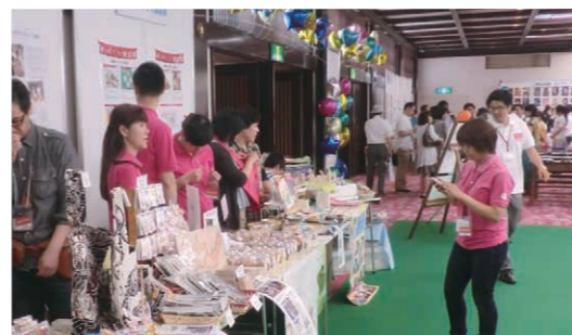
2013年度株主総会での授産品販売の様子

※授産品とは：障がいのある方が、自立した生活を営めるよう、障がい者福祉施設などでは作業訓練が行われており、授産品はそうした作業訓練の一環として、障がいのある方が製作した製品。