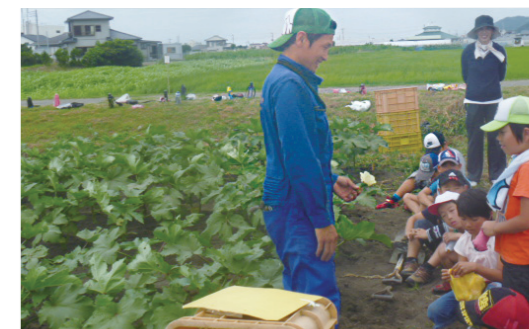
作業前の説明(ワタミファーム白浜農場にて)

地元の小学生、約60名の農業体験を受け入れ、人参の収穫を体験していただきました。収穫した人参は、白杵市学校給食センターで調理していただき、給食として提供されました。