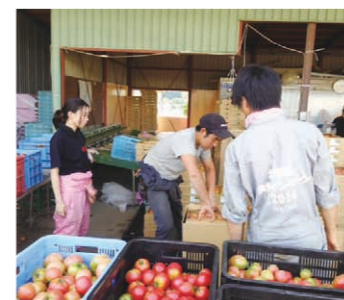
当麻グリーンライフでの農業体験

2014年度は、8月から9月にかけて3回開催し、(有)当麻グリーンライフや帯広大正農協様をはじめ、28戸の農家の方々のご協力を得て、農産物の収穫や箱詰め作業などの農作業を、約50名の大学生に体験していただきました。