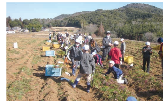
収穫の様子(ワタミファーム白杵農場にて)