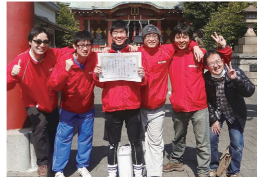
「大田スポーツGOMI拾い大会」

これからも地元へ根ざす企業として地域の皆様と交流を深めていきます。また各事業拠点においても、町内会とのつながりを大切にし、地域に密着した企業活動の展開を目指していきます。