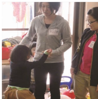
ボランティア研修の様子

2014年度は、37の施設に受け入れていただき、新入社員115名が参加しました。