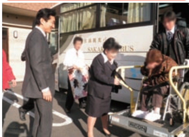
ご入居者様の受け入れの様子