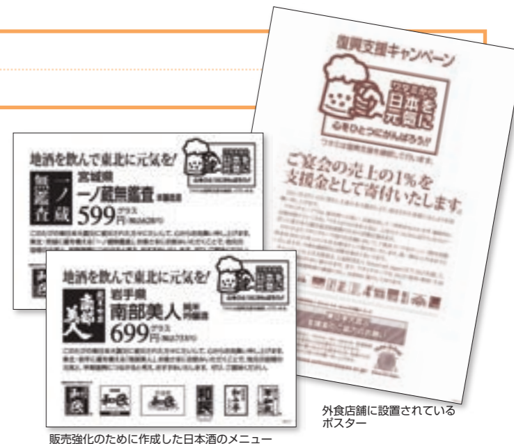
販売強化のために作成した日本酒のメニュー

加えて、4月15日よりそれぞれ岩手県と宮城県でつくられている日本酒「南部美人」(岩手県)と「一ノ蔵 無鑑査」(宮城県)を店内でお客さまにおすすめし、多くのご注文をいただけるよう販売を強化しました。