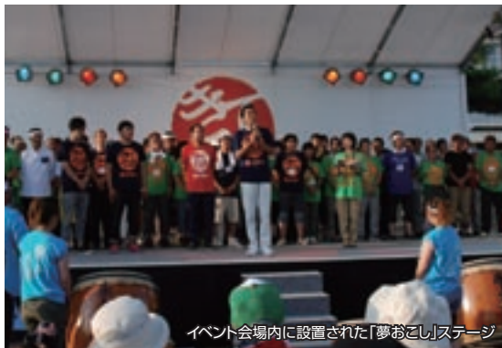
イベント会場内に設置された「夢おこし」ステージ