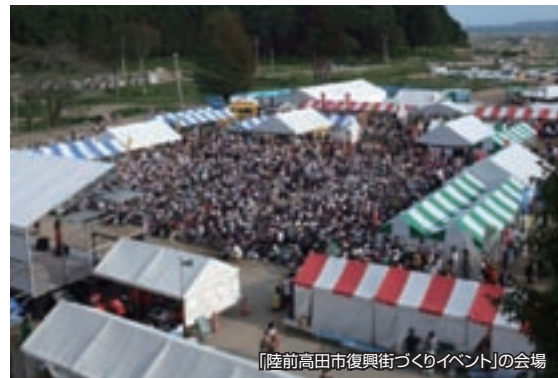
「陸前高田市復興街づくりイベント」の会場