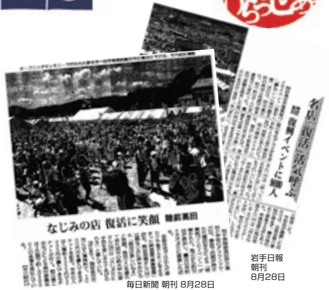
岩手日報 朝刊 8月28日