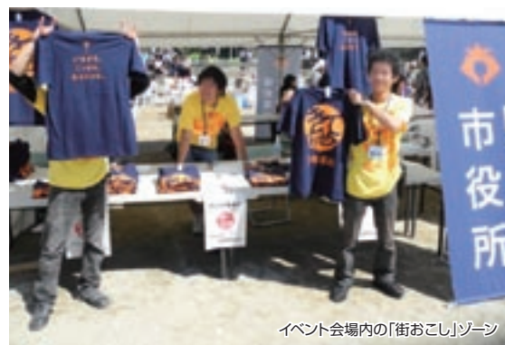
イベント会場内の「街おこし」ゾーン